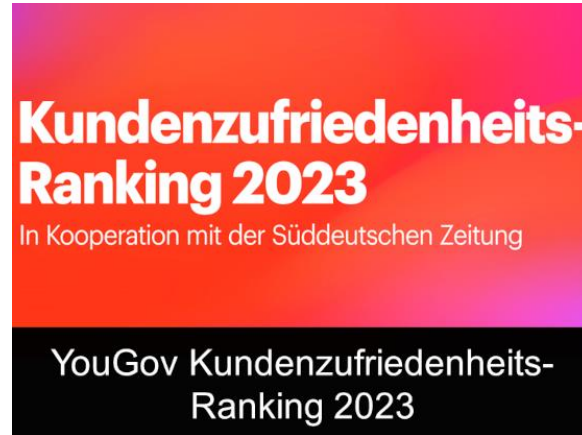
YouGov Kundenzufriedenheits- Ranking 2023