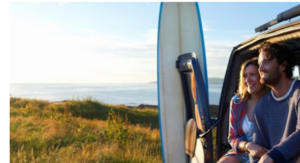
Zielgruppenanalyse Potenzielle Workationer