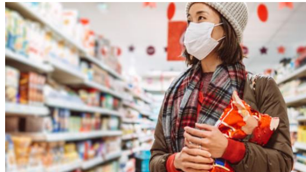
YouGov FMCG Ranking 2023