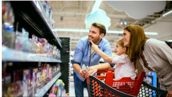
Zielgruppenanalyse Deutsche Kinderspielzeugkäufer

Laden Sie sich hier kostenlos relevante Analysen von YouGov zu verschiedensten aktuellen Themen herunter.