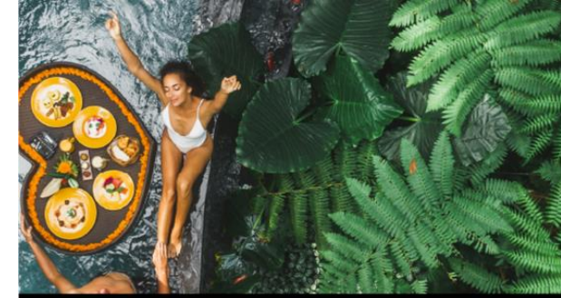
Whitepaper Luxusreisen nach der Pandemie